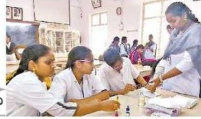
విద్యార్థుల రక్ష నమూనాలు సేకరణను వైద్య సిబ్బంది

దానిపై అవగాహన కార్యక్రమాన్ని శనివారం నిర్వహించారు. ఈ సందర్భంగా ఆయన మాట్లాడుతూ రక్షదానం వల్ల మరొక ప్రాణాన్ని నిలబెట్టవచ్చున్నారు. రక్షదానం చేసే విద్యార్థులకే కాకుండా ప్రతి ఒక్కరికీ తమ రక్తం గ్రూపు తెలిసి ఉండాలని అన్నారు. తద్వారా ఆపదలో ఉన్నవా