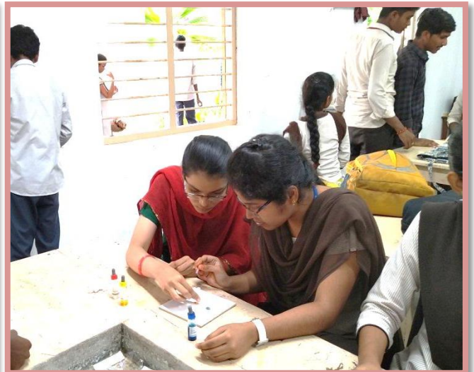
Placing the Blood drops on Porcelain tile