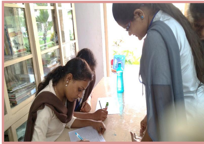
Students registering their blood group