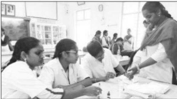
రక్ష పరీక్షలు చేస్తున్న సిబ్బంది