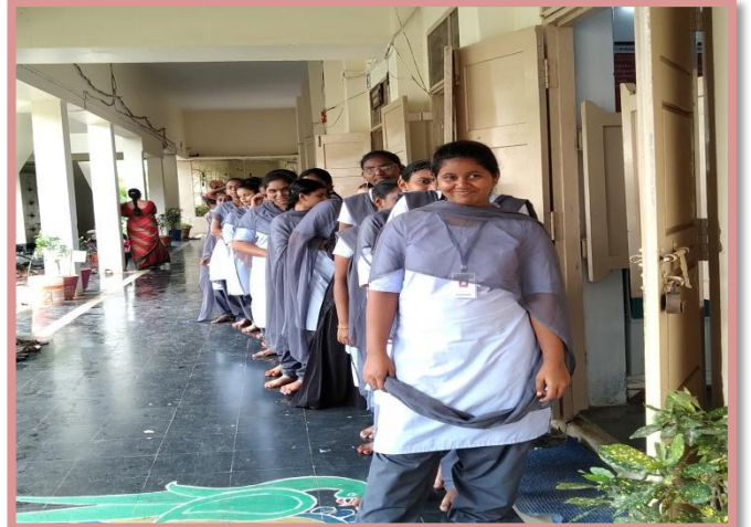
Students for Blood grouping identification