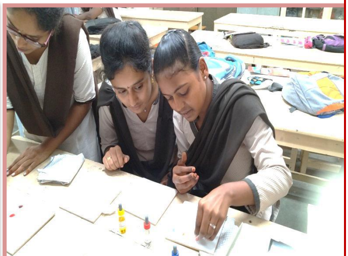
Students observing the blood group