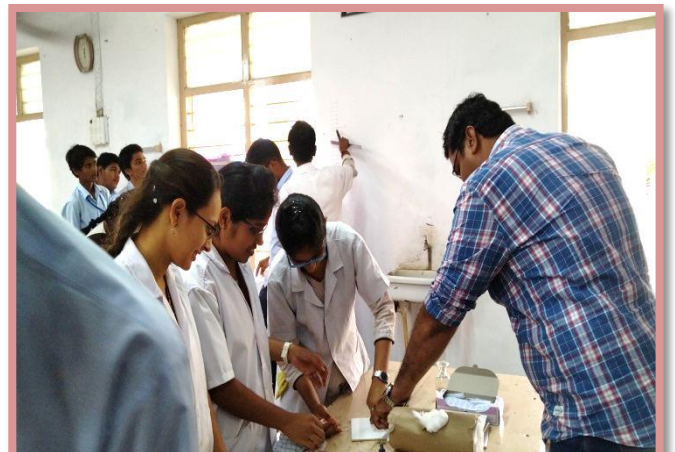
Faculty at Zoology Lab for identification of Blood Group