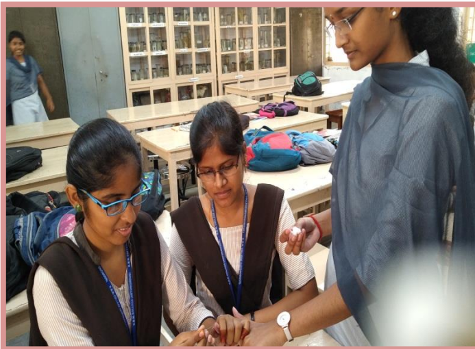
Students collecting blood drops