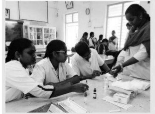
రక్తదాన పరీక్షలు చేయించుకుంటున్న విద్యార్థులు